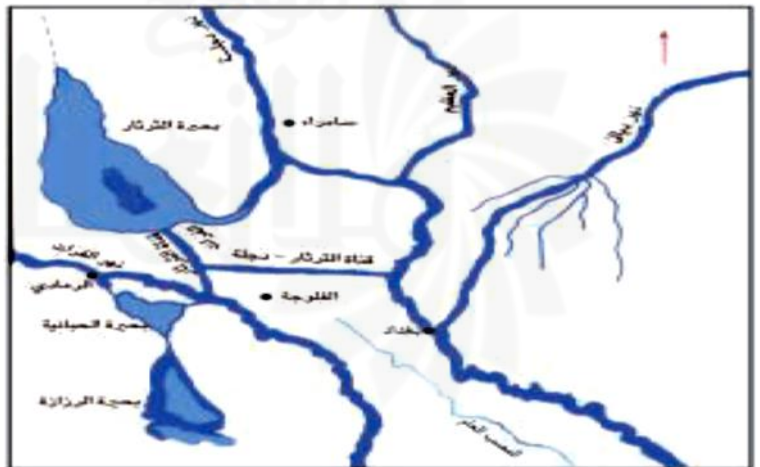
خريطة رقم ( ١٤ ) خريطة مشروعى التراث والحباتية