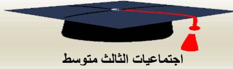
اجتماعيات الثالث متوسط